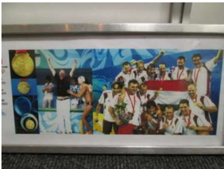
Fotó bekeretézve a férfi vízilabda válogatotról.