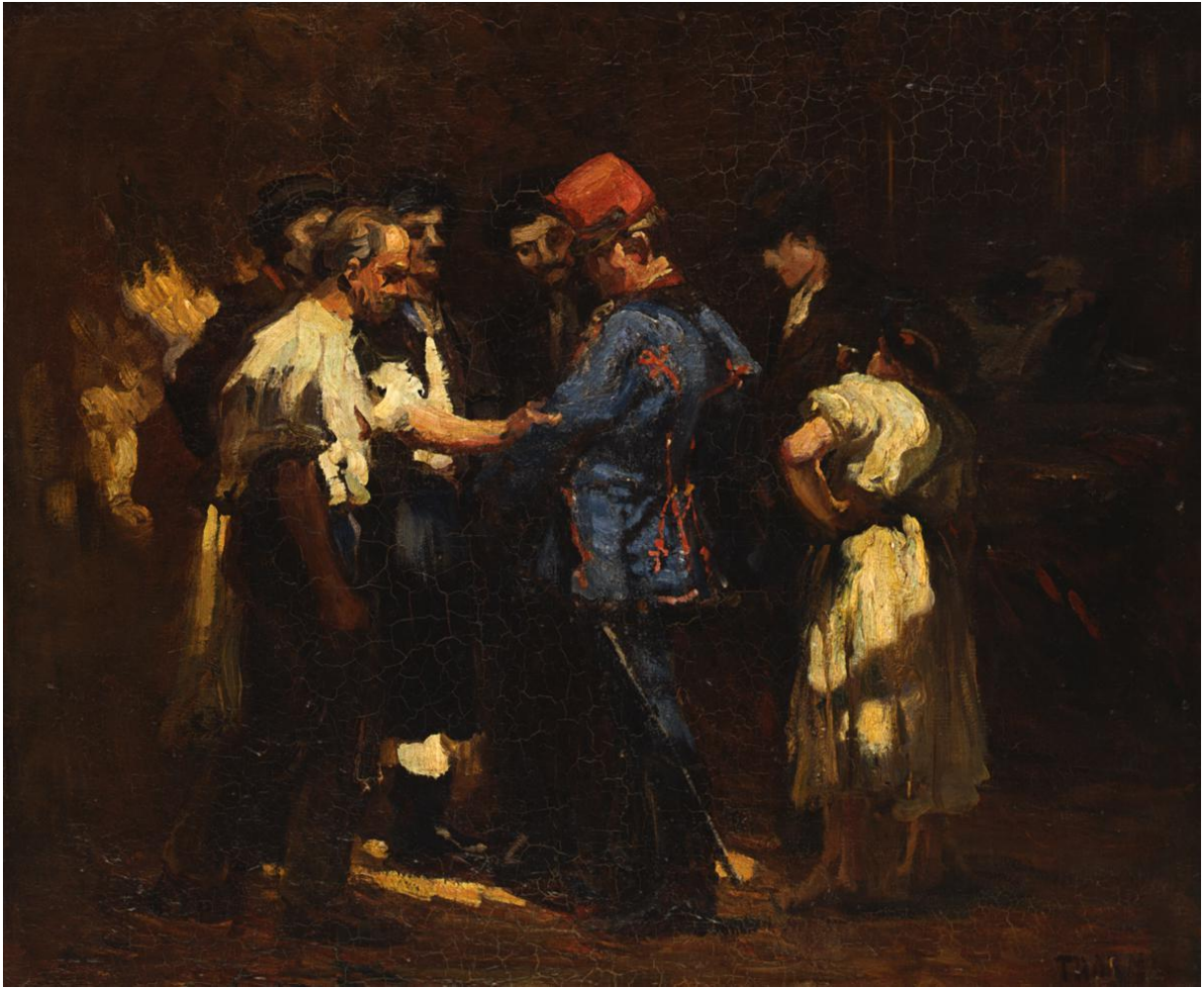
Kocsisok között (1902)