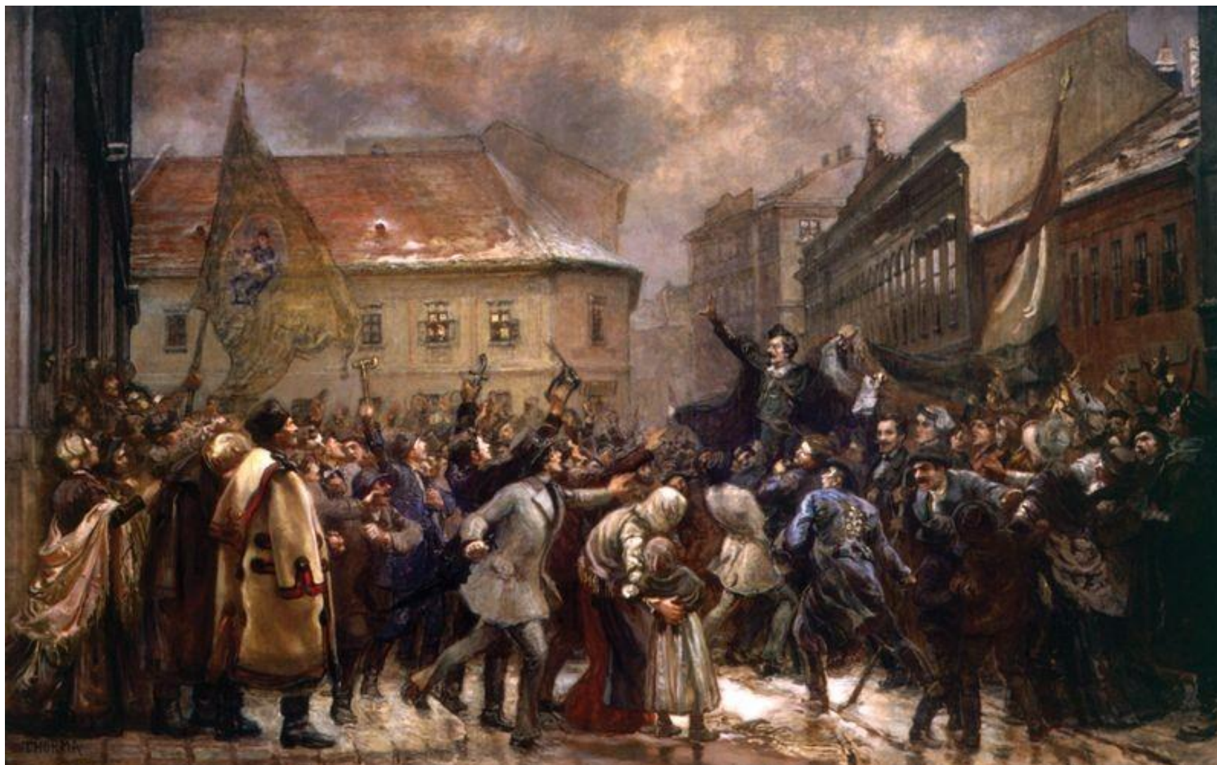
Talpra magyar! (1898–1936)