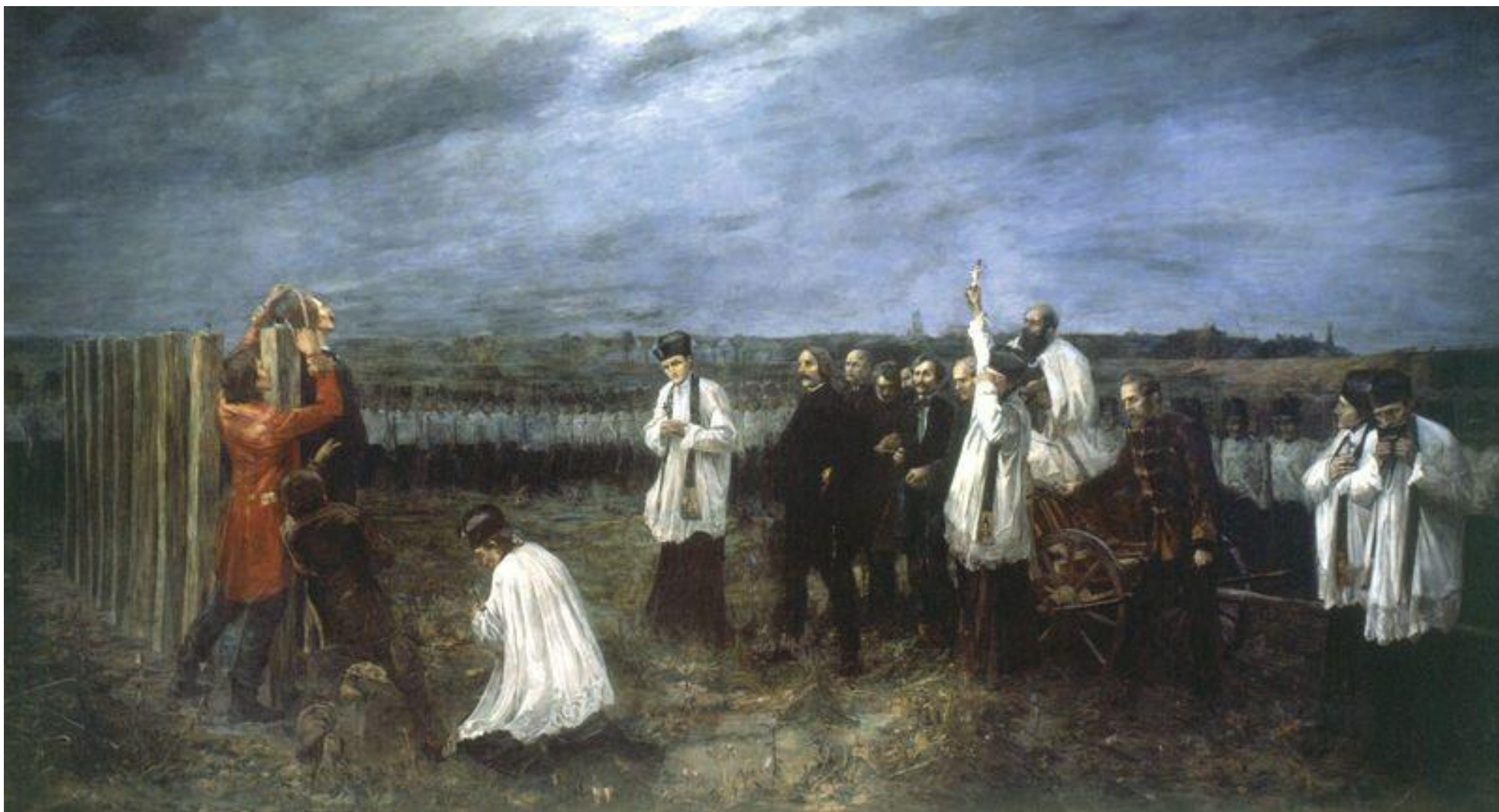
Aradi vértanúk (1893–96)