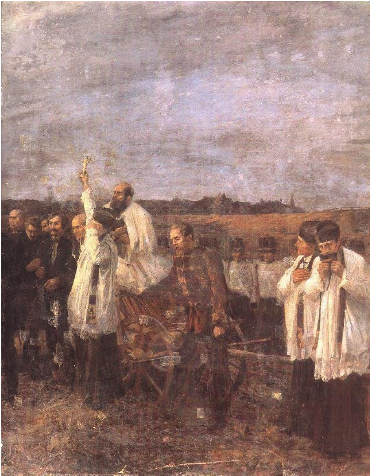
Aradi vértanúk (részlet, a festmény jobb oldala) (1893–96)

(Forrás: https://www.hung-art.hu/vezetes/nagybany/index.html )