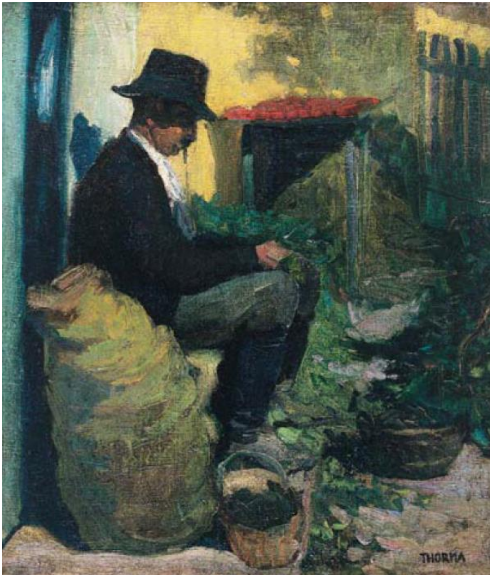
Borsót fejtő parasztember (1910 k.)

(Forrás: Bay–Boros–Murádin: Thorma. Körmendi Galéria, Budapest, 1997)