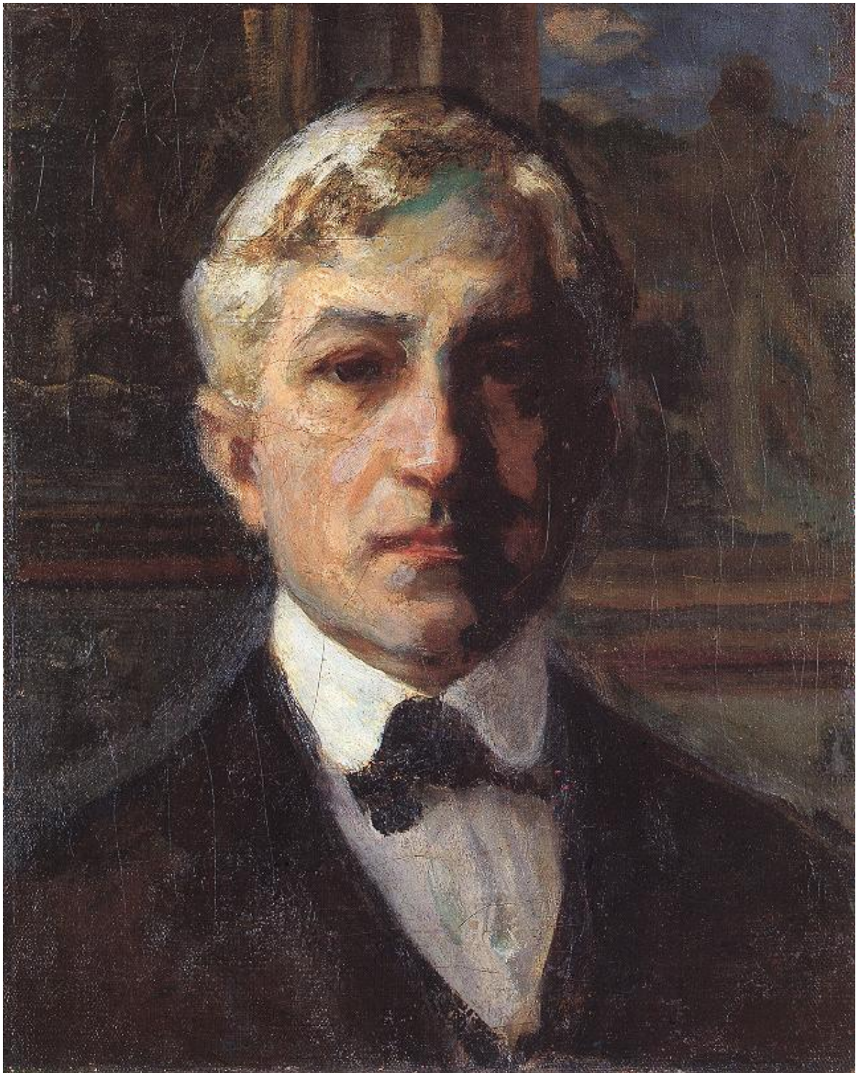
Önarckép (1910 k.)