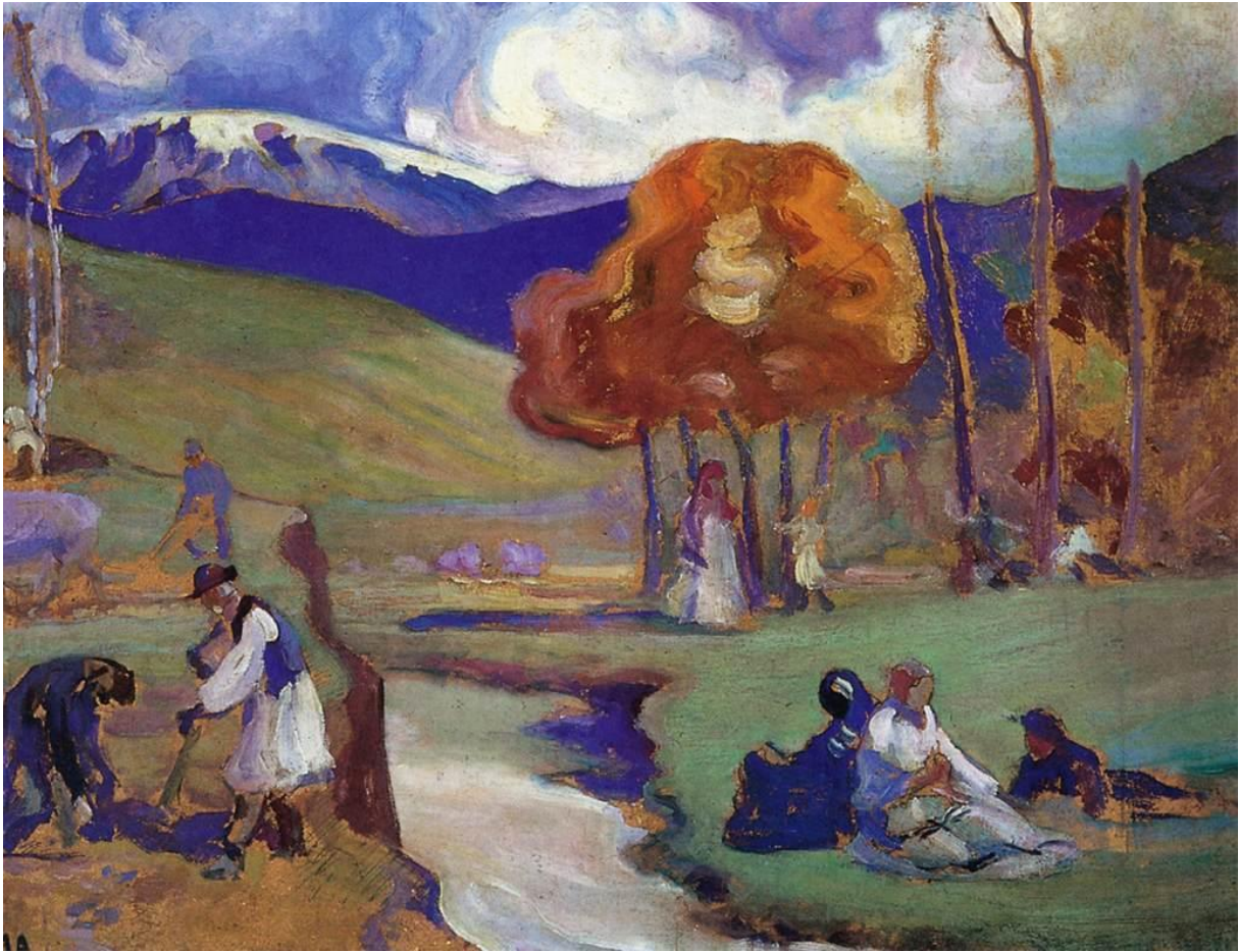
Őszi táj (1920)