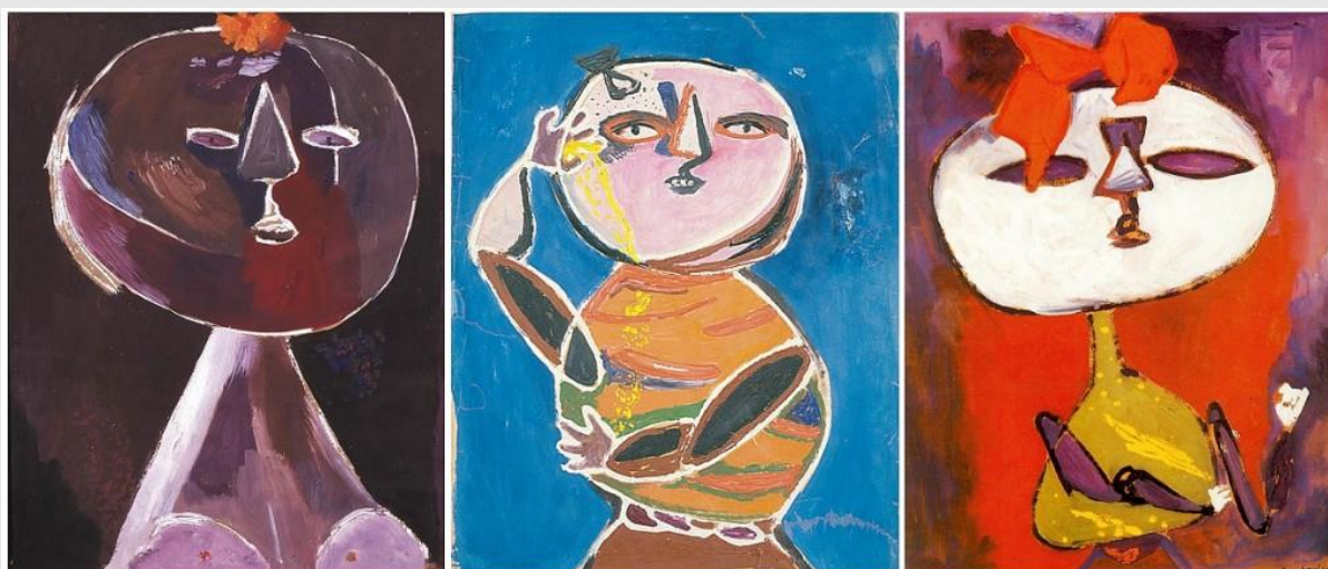
Anna Margit festményei: Fej (1946); Gondolkodó (1948); Bábu (1948)