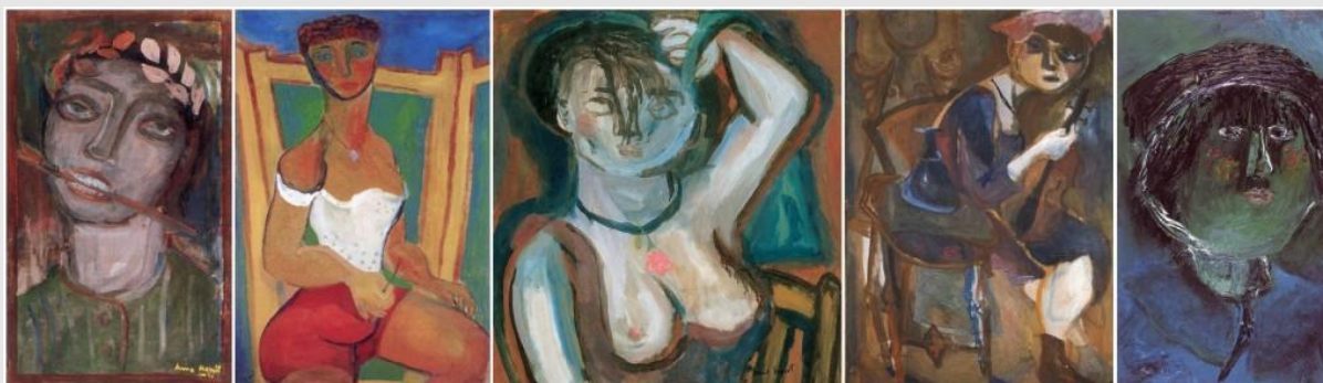
Anna Margit festményei: Önarckép (1937); Önarckép fürdőruhában (1939); Fésűs önarckép (1940 körül); Önarckép (1946); Önarckép (1966)