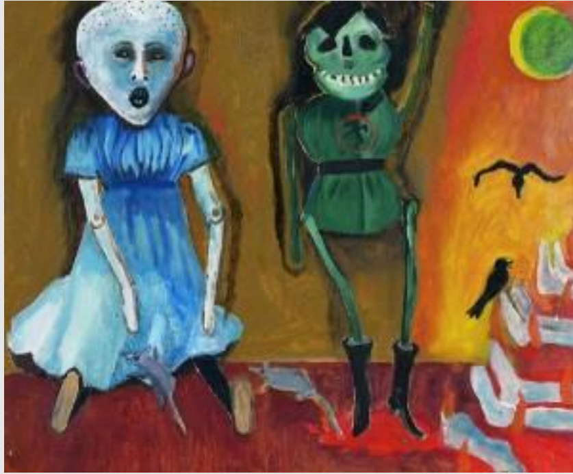
Anna Margit: Csak azt tudnám feledni... (1980)