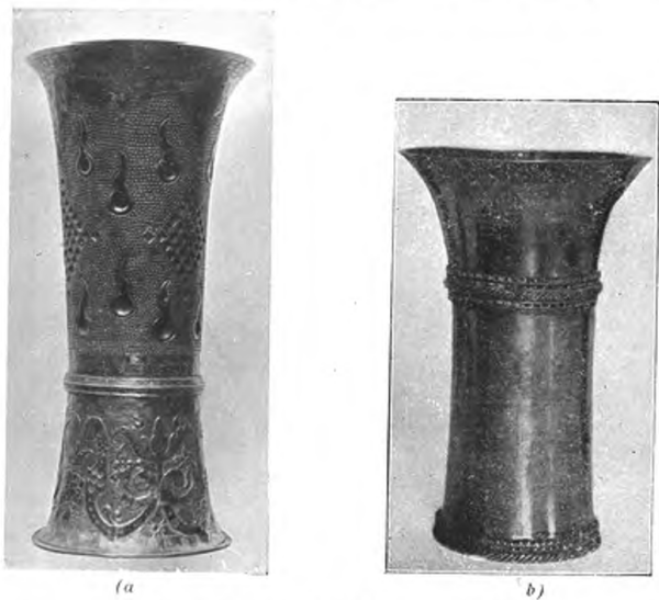
IX. Kép. Ezüstpharak a Déri Múzeumban.