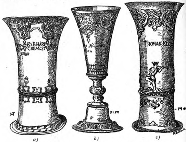
VIII. Kép. Ezüst poharak a Déri Múzeumban.

3. Nádudvari figurás pohár. Eredetileg világi célra készült. Vertmívű három alak van a pohár hengerded derekán: egy bohóc, egy tán-