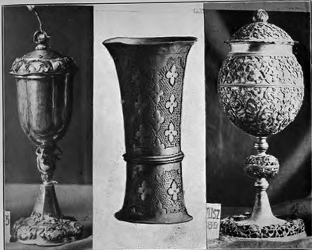
V. Kép. a) Zománcos pohár 1745. A debreceni református egyházé. — b) Az elpusztult tedeji református egyház pohara. 1631. A debreceni Kollégiumé. — c) Strucctojsás serleg XVII. sz. A debreceni Kollégiumé.