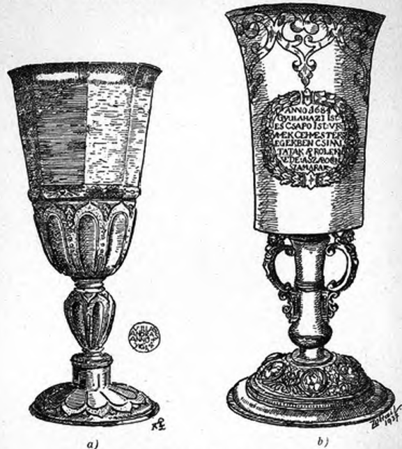
X. Kép. Ötvösművek a Déri Múzeumban.

kacsos, leveles, indás bordúrral. Fenekén 20. a. jelzésű mesterjegye, amelynek értelme lehet Michael Ethwes (1550 körül), vagy Martinus Ethwes (1572—87 közt), akár Mathias Ethwes (1586 táján) debreceni ötvösmester neve is; méginkább valamelyik más a század első felében élt ösmertelen ötvös neve lappang benne. Kőszeghy E. is debreceni műnek sejtí. 42 (IX. kép, b.)