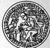
A debreceni ötvös céh pecsétnyomója.