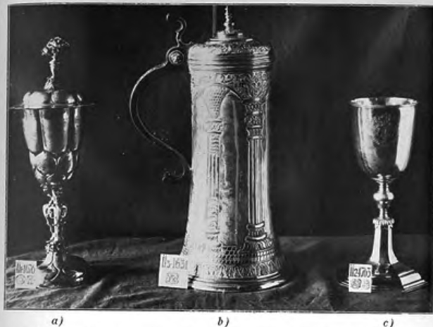
I. Kép. A debreceni református Nagytemplom úrasztali ezüst edényei.

Oszlopos boltozott csarnokot ábrázoló oldalán barokk ízlésű dús levél, virágdíszítés. Meglepő, hogy mesterjegyként ugyanaz a két betű SB van, ugyanazon négyszögű kerettel beütve — 32. b. — amely XVIII. századbéli néhány más templomi edényen fordul elő és Békési István (Stefanus B) vagy Békési Sámuel (Samuel B.) vagy Büttösi István (Stefanus B.) nevét rejti. Kőszegi Elemér Büttösi István mester-