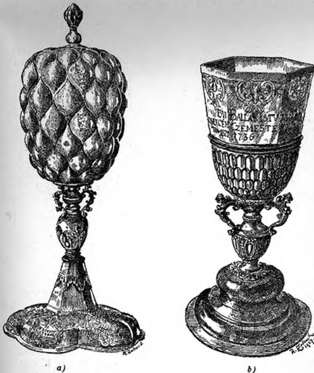
VII. Kép. Ezüstpoharak a Déri Múzeumban.