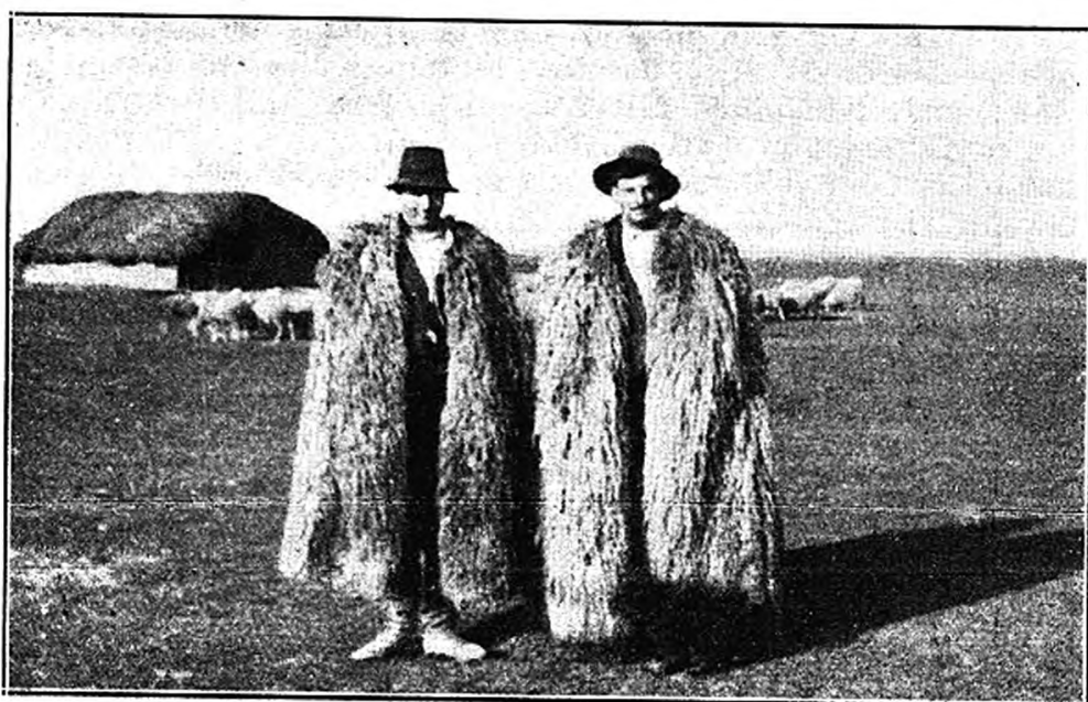
Fig. 1. kép.

4. A feles juhász átad a gazdának pl. száz anyabirkát és azokhoz három kost. A gazda fizeti a legelőbért, téli takarmányt és szállást ad. A juhász kap kommenciót is. Három évig