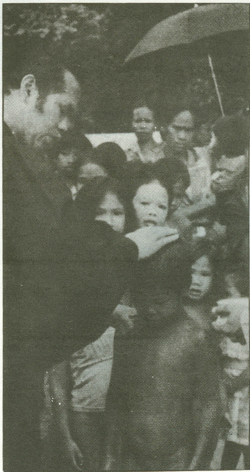
Sumátrai Kubu nép gyermekei egy istentiszteleten