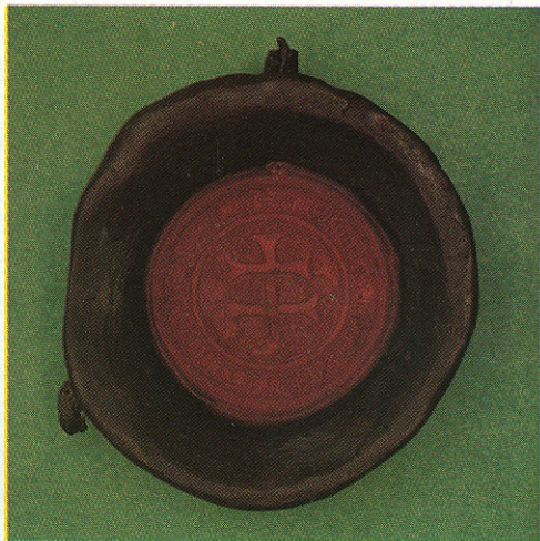
Az országnagyok kettőskeresztes pecsétje (1446). A Hunyadi János kormányzóságát megelőző, király nélküli időszakban a kormányzó országnagyok is a hagyományos címerábrázolást használják

meg az illusztrátor: Károly Róbert seregei vágásos-liliomos zászló alatt vonulnak fel a csatamezőn, egy másik hadilobogót kettőskereszt díszít. A királyi zászló hordozója már elesett, a kettőskeresztes zászló összetörve hever a lovak lábánál, a holtak között. A király öltözékén a különféle uralkodói szimbólumok együtt jelennek meg: mellén kettőskereszt, pajzsán vágásos-liliomos címer, sisakján struccotlak. Hasonló együttes látható a Képes Krónika címlapján, ahol Nagy Lajos képe alá a vágásos-liliomos, kettőskeresztes címert, és az Anjouk sisakdíszét, a patkót harapó struccot festik.