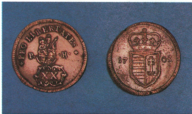
A Rákóczi-szabadságharc alatt vert »Pro libertate» »A szabadságért» feliratú rézpénz a koronás kiscímer képével