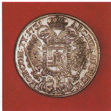
III. Károly ezüst tallérja 1731-ből

a birodalomba. Az alkotmányjogi küzdelmek gyakran a címerhasználat körül csapnak össze.