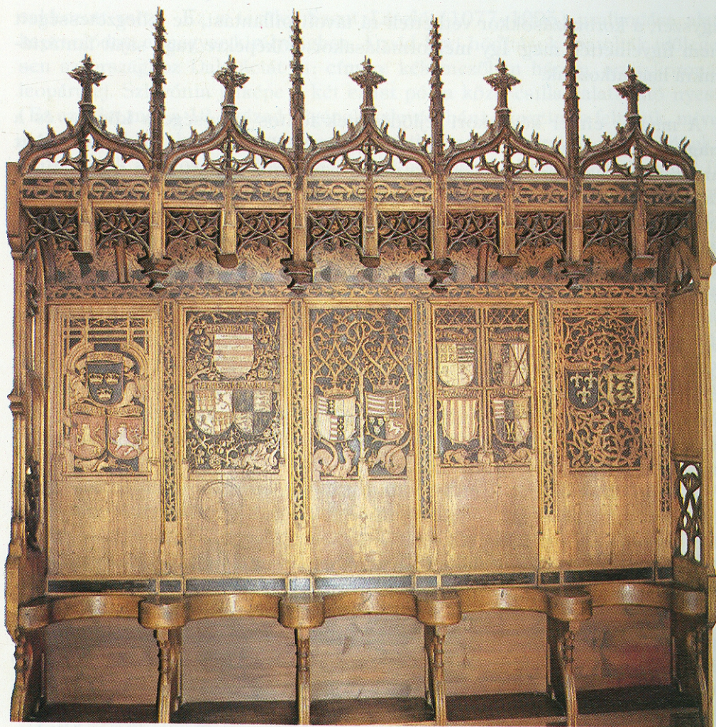
A bártfai templom faragással díszített padja, a stallum. Középen Mátyás király és Beatrix címere, mellettük uralkodók, országok címerei