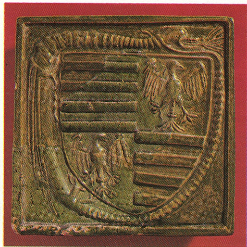
Zsigmond (1387–1437) címerével díszített mázas kályhacsempe. A sas Brandenburgra utal, az uralkodó által alapított Sárkányrend jelképe öleli körül a pajzsot