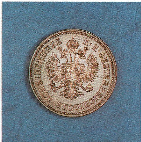
Ferenc József réz négykrajcárosa 1861-ből

Ez a heraldikai játék azért kap politikai tartalmat, mert az átalakítások során Magyarország címere eltörpül, vagy más, idegen címerek ráhelyezése miatt eltorzul, alig láthatóvá válik. Néhány esetben a nemzeti címer kiszorul