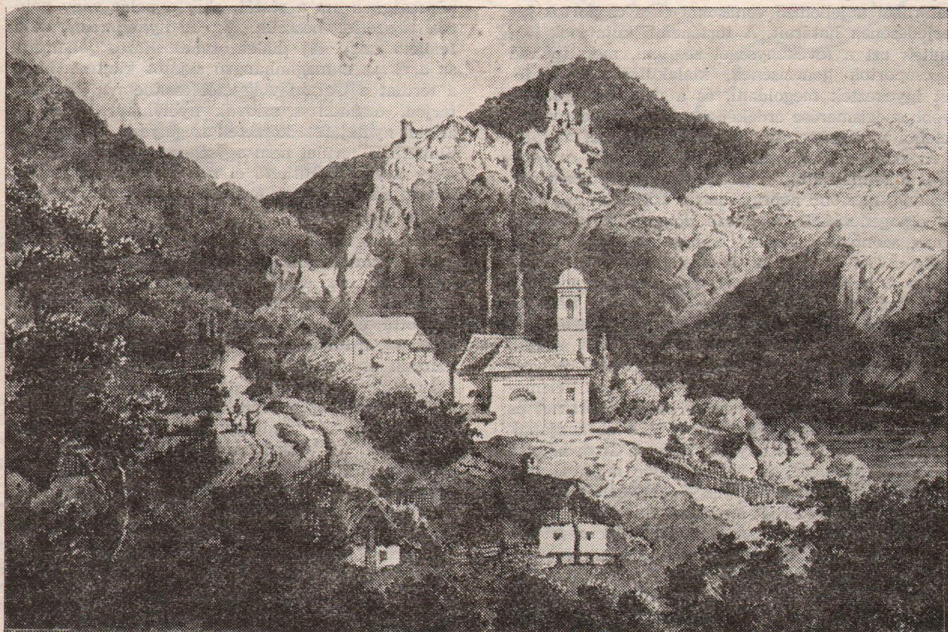
Szarvaskő falu és várrom, a múlt század közepén

E kulturális egységeket elsősorban az összetartó azonos vagy hasonló műveltségbeli vonások jellemzik. A kulturális jellemzők ugyanakkor kifelé, a szomszédos tájak lakossága felé elhatároló erőt képviselnek. Az összetartó vonások többnyire a dialektusban, az embertani jellemzőkben, az anyagi, társadalmi és szellemi kultúra egyes ágazataiban nyilvánulnak meg. Az etnikus jelleget többféle tényező indokolhatja, így a történelmi sorsközösség, a természeti feltételek, a vallási viszonyok és nem utolsósorban a népesség jogállása, a birtokviszonyok történelmi alakulása, esetleg közös nagybirtokhoz tartozás. A néprajzi csoportok kutatásának