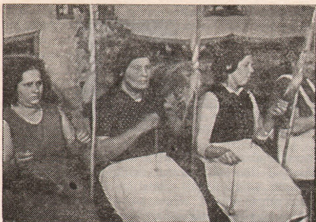
Fonó Istenmezején, 1960-ban

módszere tehát kétlépcsős: előbb fel kell tárnai a csoportot befelé összetartó, kifelé elválasztó vonásokat, majd a történeti és egyéb körülmények mérlegelése révén mindezt indokolni szükséges.