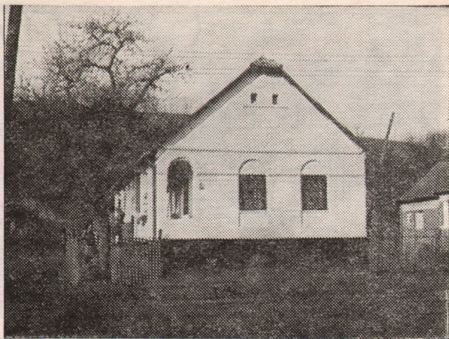
1905-ben épített lakóház Fedémesen

medence falvai, a széki és az egri falucsoport. Bár Heves megyébe a XVIII. század folyamán több ízben is telepítettek a földesurak idegen nemzetiségű — német, szlovák — jobbágyokat, a Mátra-gerinc—Eger vonaltól északra eső területet ez a kolonizáció alig érintette.