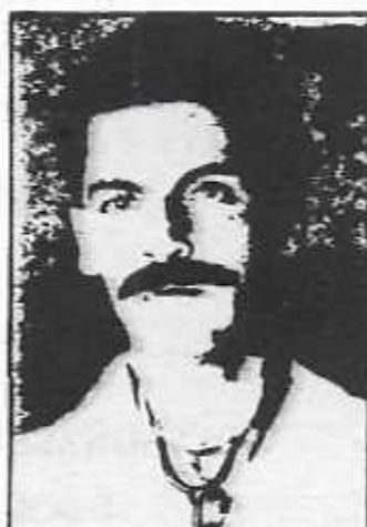
Rofman doktor felfedezése (a zsírromboló, természetes fehérje) forradalmasította a kutatásokat a végleges fogyókúra terén.

Jól írták a reklámriportban az érdem és az orvos megnevezését? Döntsd el! A megoldásban segít az itt található kép alatti szöveg és A magyar helyesírás szabályai című könyv. A "Szabályzat" c. rész-ből keress szabálypontokat erről a két helyesírási kérdésről! Írd le a szabálypontok számát!